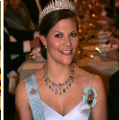
Victoria von Schweden